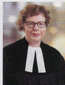
Dr. Beate Hofmann

wird als Bischof der Evangelischen Kirche von Kurhessen-Waldeck in den Ruhestand verabschiedet.